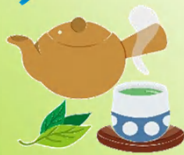
美味しいいただきます

たくさんのほうじ茶の茶葉をいただきました。私共の高齢者施設に心寄せてくださり、厚くお礼申し上げます。