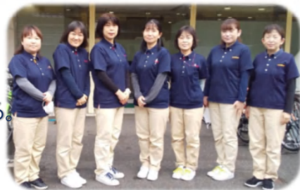
1人1人に適切な介護サービスを 提供いたします