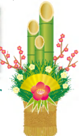
ご利用者様の作品