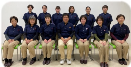
芳梅会の訪問介護事業は平成12年にスタートし、 現在14名のスタッフで活動しています。

利用者様お宅に訪問し、食事や入浴・排泄などの身体介護、掃除・洗濯・調理等の生活援助など、それぞれのご希望に合わせた在宅生活のお手伝いをさせていただいています。利用者様が住み慣れた場所で、いつまでも安心して生活していただけるよう、温かいケアを心がけています。